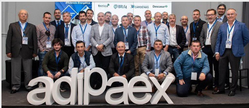
I Encuentro Profesional, celebrado en La Galería ABC, en Sevilla, el 27 de octubre de 2021.