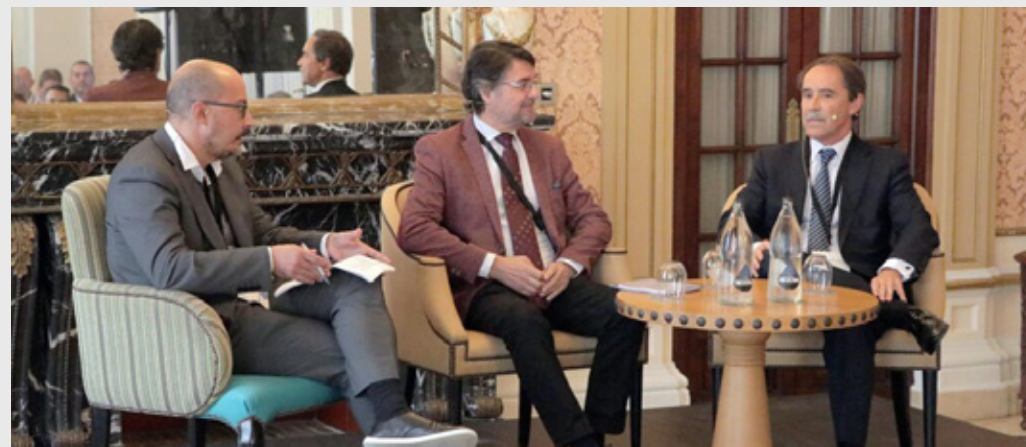
II Encuentro Profesional, celebrado en el Hotel Alfonso XIII de Sevilla, el 24 de noviembre de 2022.