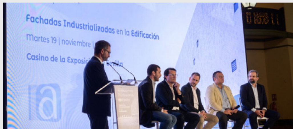
IV Encuentro Profesional, celebrado en el Casino de la Exposición de Sevilla, el 19 de noviembre de 2024.