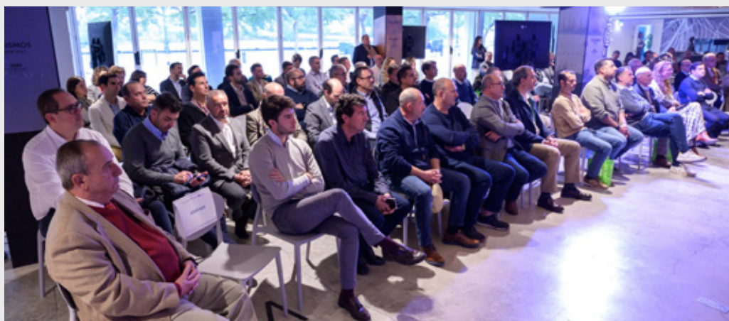
III Encuentro Profesional, celebrado en el Espacio Exploratererra de Sevilla, el 28 de noviembre de 2023.